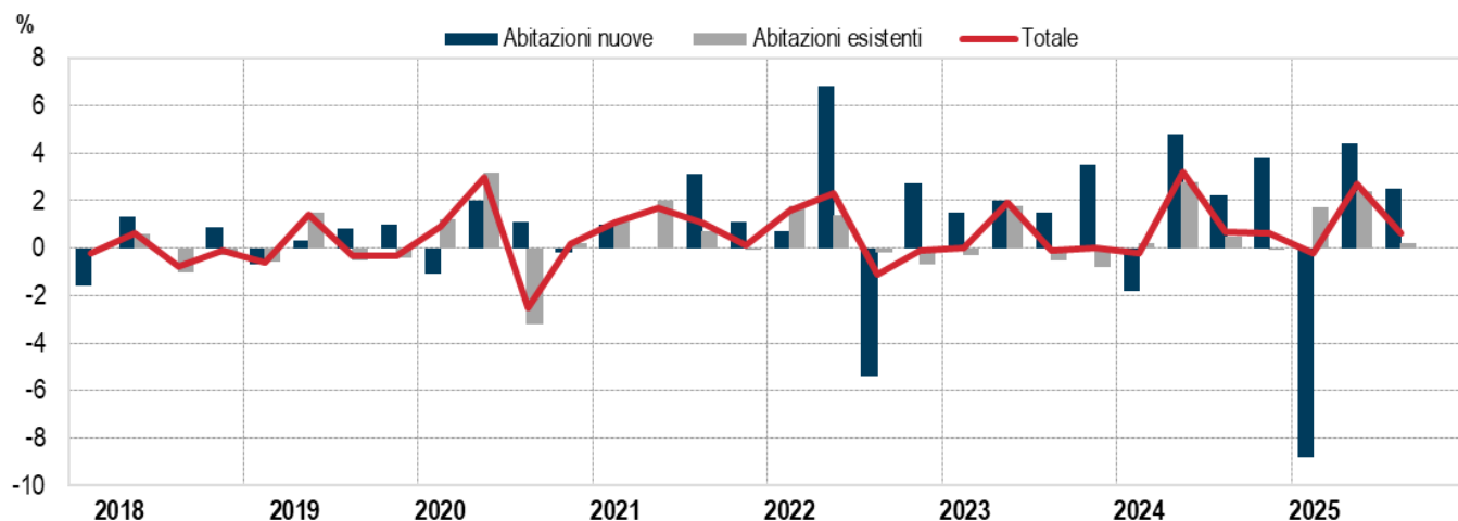
FIGURA 3. INDICI DEI PREZZI DELLE ABITAZIONI NUOVE ED ESISTENTI

I trimestre 2018 - III trimestre 2025, variazioni percentuali congiunturali (base 2015=100)