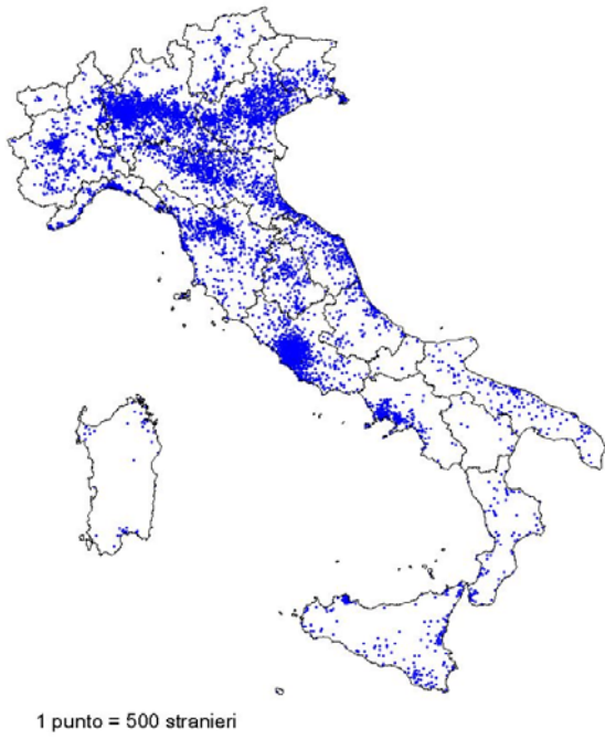
Figura A.1. Stranieri residenti per comune al 1° gennaio 2010