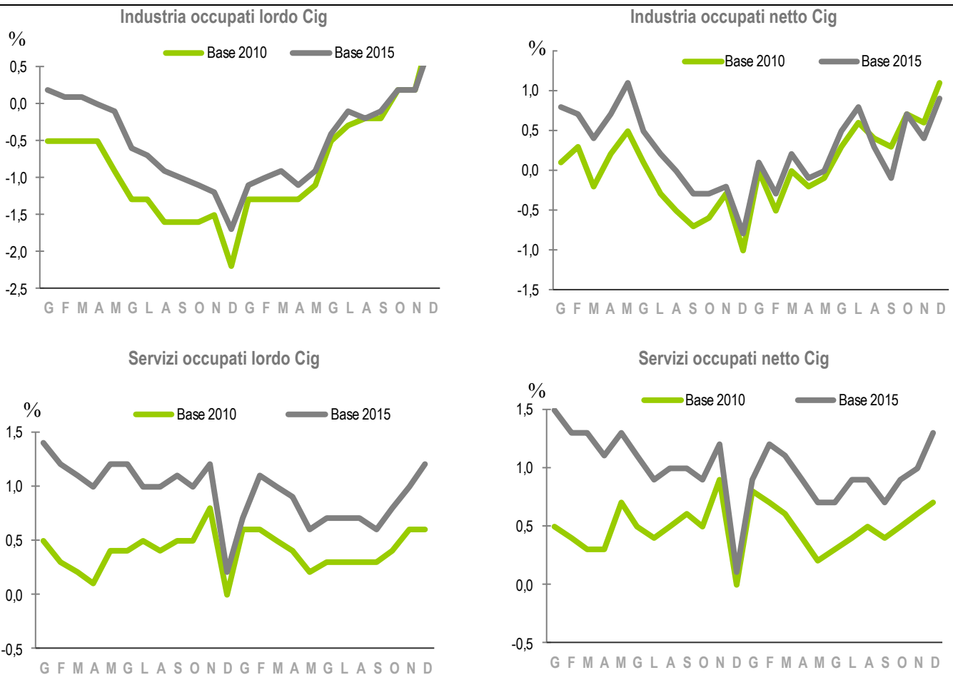
FIGURA 1. VARIAZIONI PERCENTUALI TENDENZIALI DEGLI INDICI RELATIVI ALL'OCCUPAZIONE AL LORDO E AL NETTO CIG NEI SETTORI DELL'INDUSTRIA E DEI SERVIZI, IN BASE 2015 E IN BASE 2010

In primo luogo emerge che, sia per l'industria sia per i servizi, la dinamica dell'occupazione (tanto al lordo, tanto al netto della Cig) misurata dagli indici in base 2015, risulta meno sfavorevole nell'industria e più favorevole nei servizi, rispetto a quella misurata dagli indici in base 2010 (Figura 1). Si nota, in particolare, il profilo nettamente migliore dell'occupazione al netto della Cig del settore industriale nel 2016 e un lieve peggioramento nel 2017. Nei servizi le nuove serie mettono in luce un profilo decisamente positivo in entrambi gli anni.