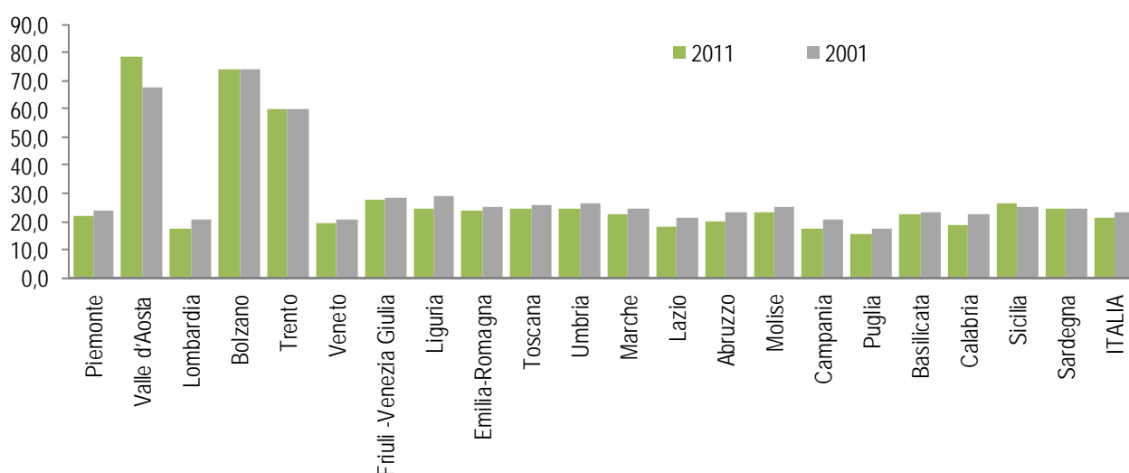
Grafico 1. Numero di addetti nelle Regioni, negli Enti locali e nelle Aziende ed enti del servizio sanitario nazionale per regione. Censimenti 2011 e 2001, valori per mille abitanti

Rispetto al 2001 l'incidenza dei dipendenti di Regioni, Enti locali e Aziende ed enti del servizio sanitario nazionale sulla popolazione residente è diminuita in Italia da 23,5 a 21,5, ma non in tre Regioni che nel decennio hanno ulteriormente aumentato il già elevato rapporto: in Valle d'Aosta l'indicatore è aumentato da 67,8 a 78,7, a Trento da 59,8 a 60,2, in Sicilia da 25,5 a 26,5 (Grafico 1).