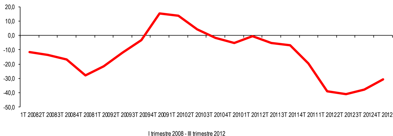
FIGURA 2. MUTUI, FINANZIAMENTI, ED ALTRE OBBLIGAZIONI CON COSTITUZIONE DI IPOTECA IMMOBILIARE E TRIMESTRE. Anni 2008-2012, variazioni percentuali tendenziali

(a) Convenzioni contenute negli atti notarili.