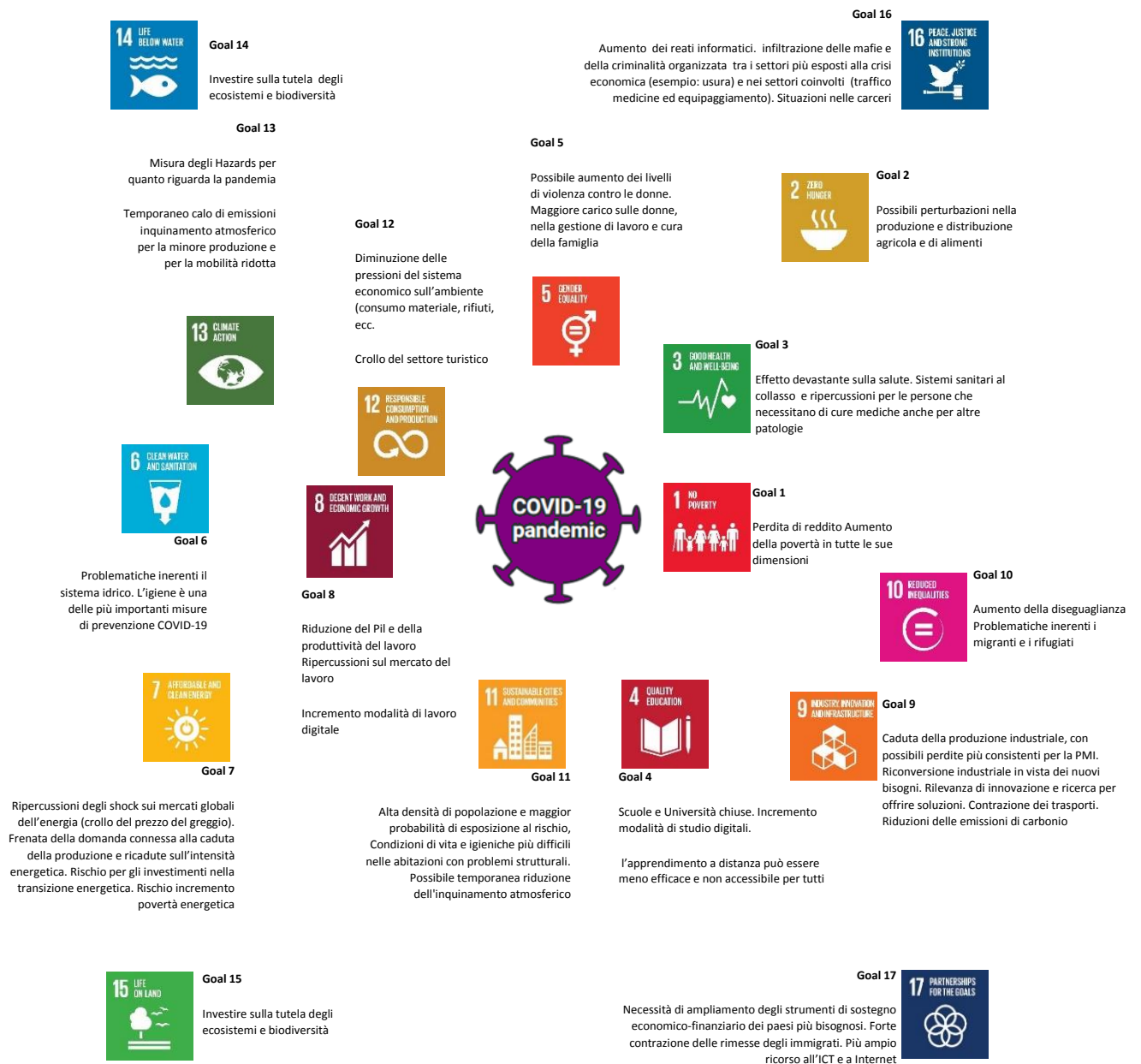
Figura 3. Interconnessioni SDGs e COVID-19