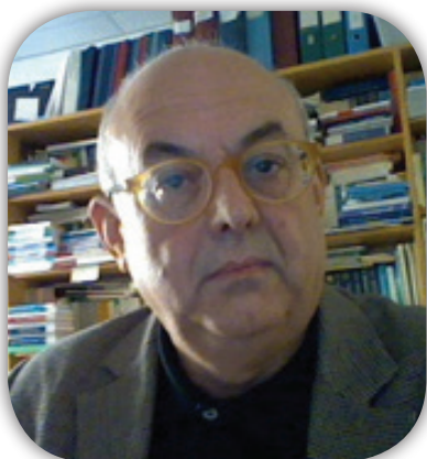
Tavola Rotonda “Qualità dell’informazione statistica nell’era digitale”