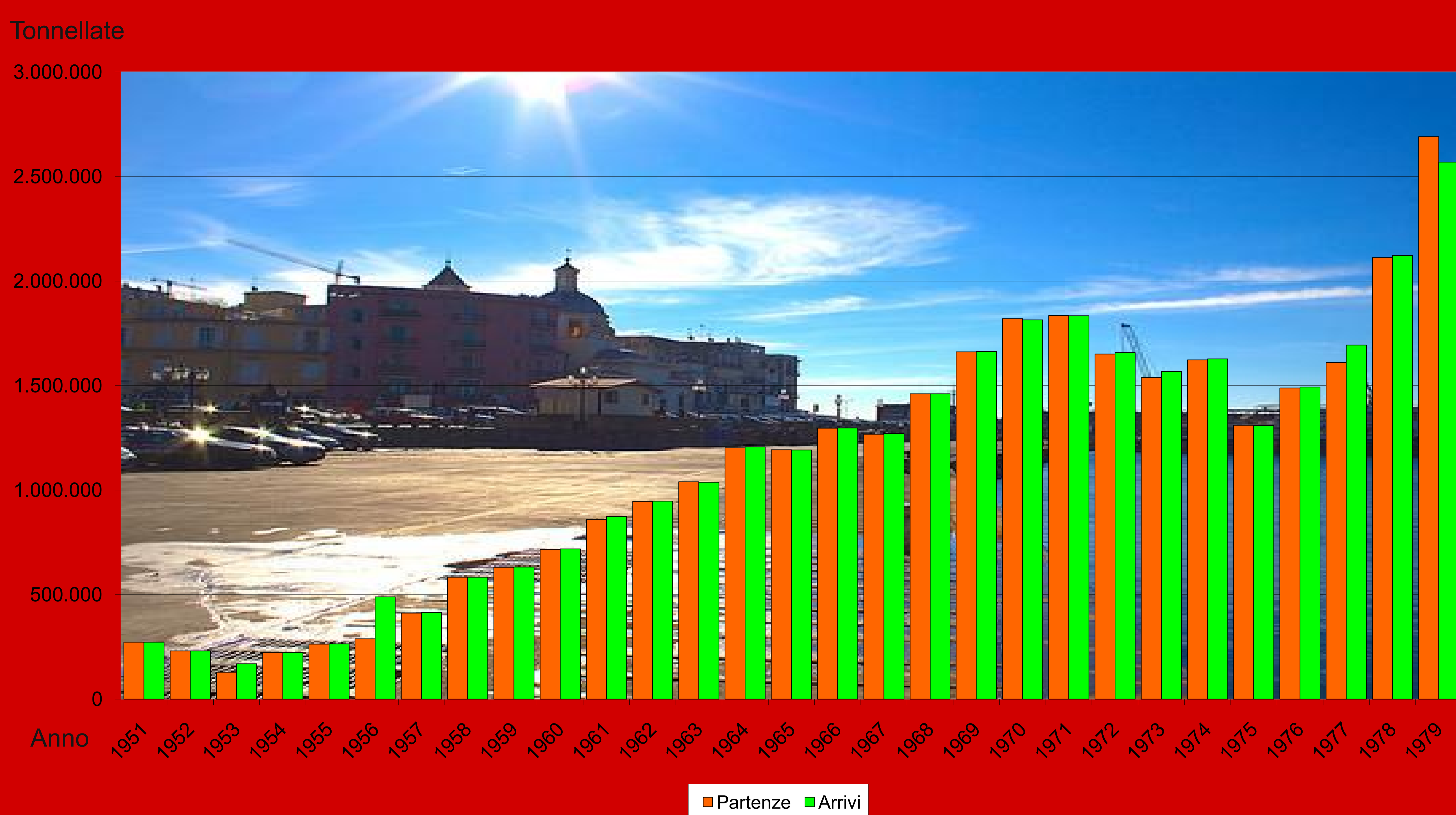
Porto di Pozzuoli Movimento Merci