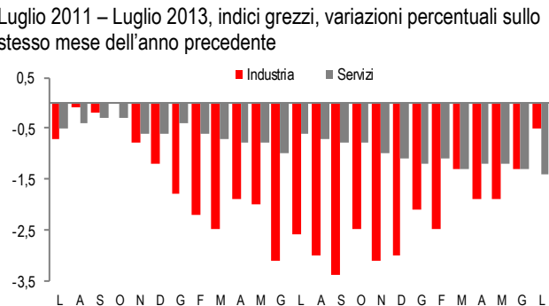
OCCUPAZIONE AL NETTO CIG NELLE GRANDI IMPRESE DELL'INDUSTRIA E DEI SERVIZI Luglio 2011 – Luglio 2013, indici grezzi, variazioni percentuali sullo stesso mese dell'anno precedente