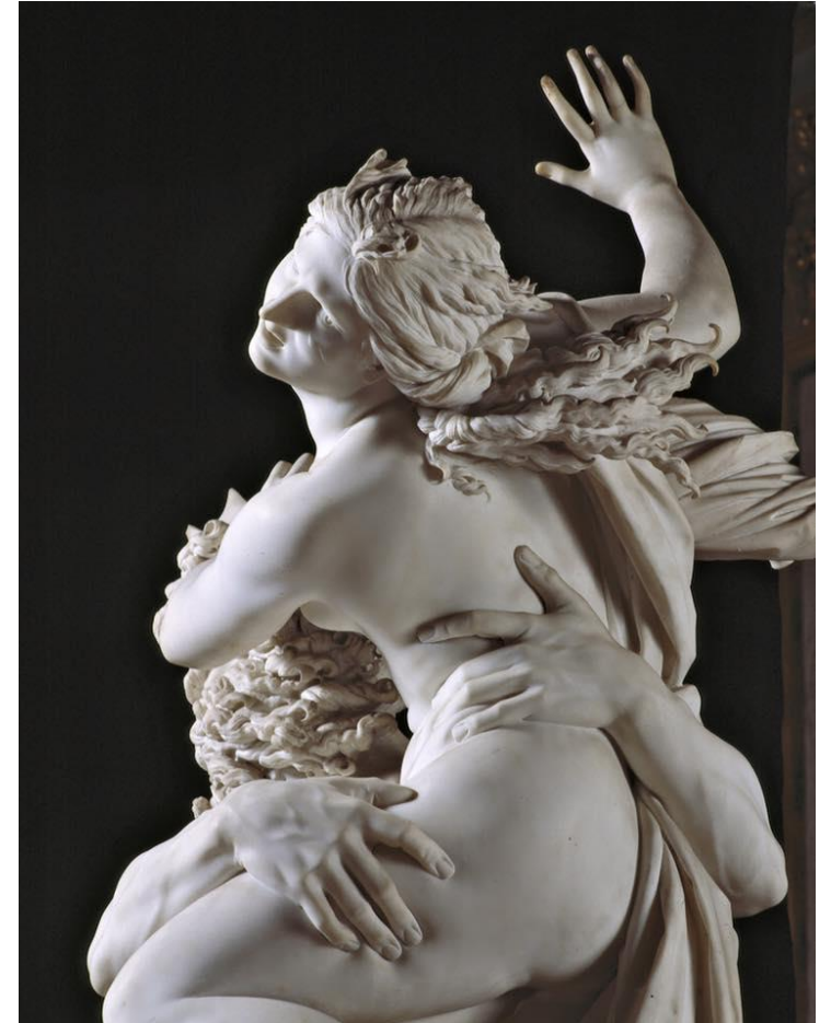
Il ratto di Proserpina, Gian Lorenzo Bernini, 1622