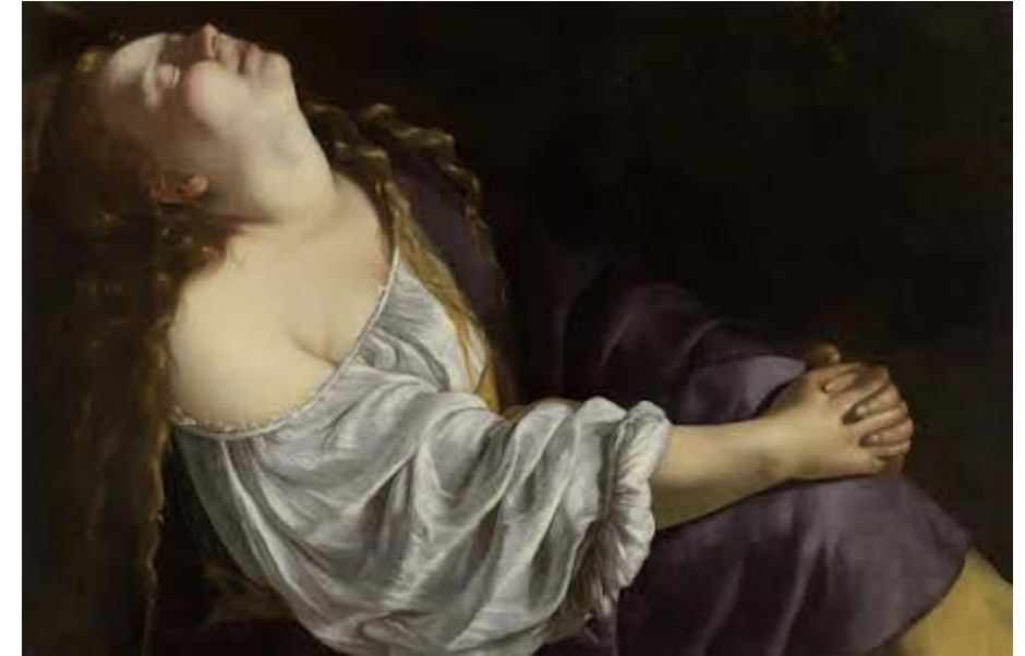
L'estasi di Maria Maddalena, Artemisia Gentileschi, 1620